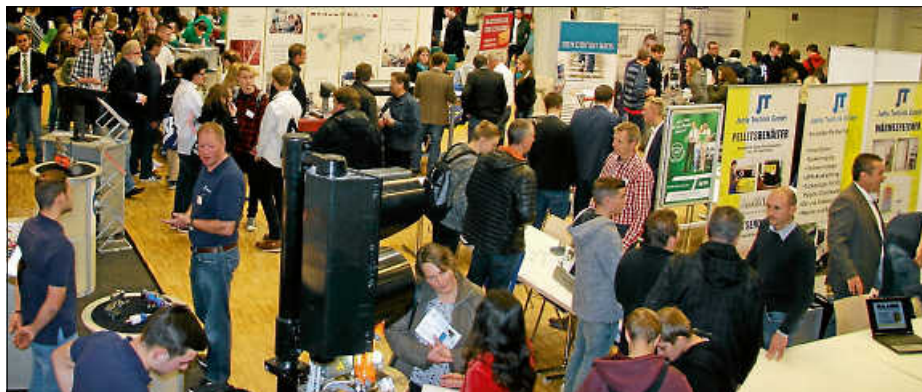
Beim Job-Info-Tag können sich Nachwuchskräfte und Arbeitgeber austauschen.

Aufgrund der zu erwartenden hohen Besucherzahl, wird dringend empfohlen, bei der Anreise öffentliche Verkehrsmittel zu nutzen. Wer dennoch mit dem Auto kommen möchte, wird gebeten, das Parkhaus „An der Akademie“ anzusteuern. Dieses ist nur wenige Gehminuten vom Veranstaltungsgelände entfernt.