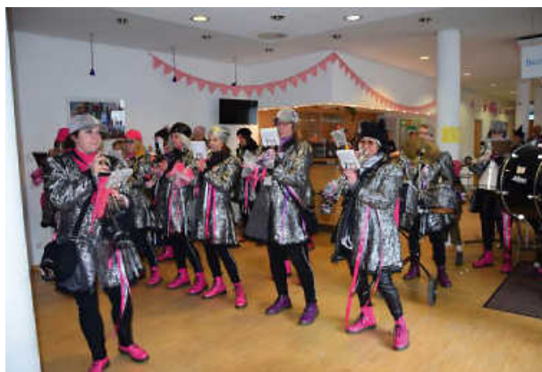
Die Omägenis im Bürgertreff Ostertagshof im Jahr 2020