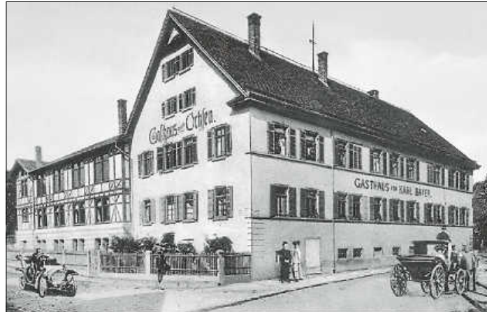
Neuhausen auf den Fildern Gasthaus "Zum Ochs" um 1910