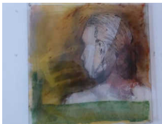
Peter Dannenhauer, ohne Titel, 2017