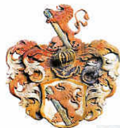
Wappen Philipp II. von Alfdorf

Eine Inschriftentafel sowie sein Wappen am dortigen Rathaus zeugen davon.