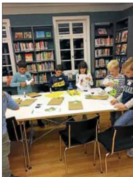
Beim Basteln der Olchi-Mülltüte

Virtueller Büchereibestand: Über 700 aktuelle E-Book-Titel zum Download über die "Onleihe"