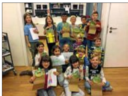
Alle Olchi-Experten auf einen Blick!

Onleihe = E-Books online ausleihen, rund um die Uhr, 7 Tage die Woche! Leihfrist bis 21 Tage, Rückgabe entfällt! Für alle Geräte geeignet: PC, Laptop, Tablet iOS und Android, Smartphone, E-Book-Reader.