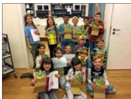
Alle Olchi-Experten auf einen Blick!

Onleihe = E-Books online ausleihen, rund um die Uhr, 7 Tage die Woche! Leihfrist bis 21 Tage, Rückgabe entfällt! Für alle Geräte geeignet: PC, Laptop, Tablet iOS und Android, Smartphone, E-Book-Reader.