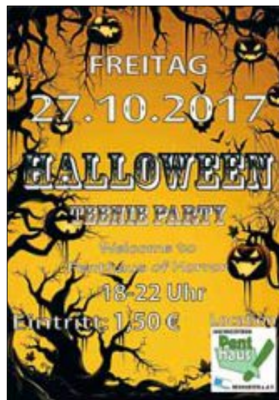
Das Penthaus TEAM

Vorschau: 25.10. Kürbisschnitzen am Aktionsnachmittag 27.10. Halloween-Teeniedisco für Kids bis 15 Jahre.