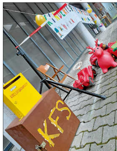
die Siegerinnen und Sieger erhielten ihre Preise dann am nächsten Tag ebenfalls mit der Post.