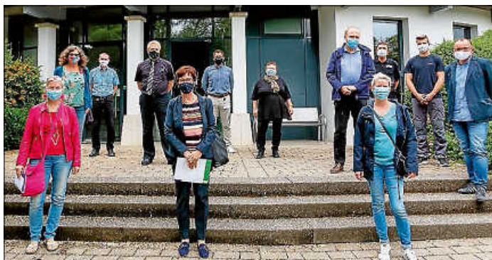
Balluff spendete insgesamt 300 Gesichtsschilder an Neuhäuser Einrichtungen.

Der Sensor- und Automatisierungsspezialist fertigte Gesichtsschilder und spendete diese zusammen mit einfachen Masken an Krankenhäuser und soziale Dienste in der Umgebung, unter anderem an die medius-Kliniken in Ruit, an das Marienhospital, an die Margarete-Steiff-Schule für Kinder mit besonderem Förderbedarf in Stuttgart, an die Diskaoniestation in Aich-Erms-Neckartal und an Einrichtungen in Neuhausen. Um vor Krankheiten wie dem Coronavirus zu schützen, kommen in